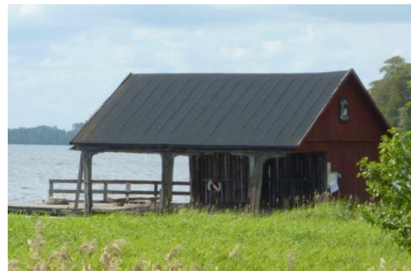
Var finns detta båthus? SÄTRA