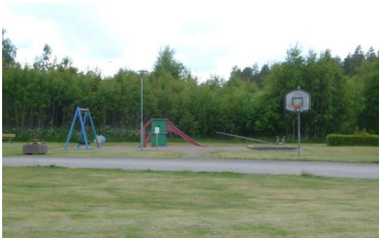
Var finns denna lekplats? LAGERFORS