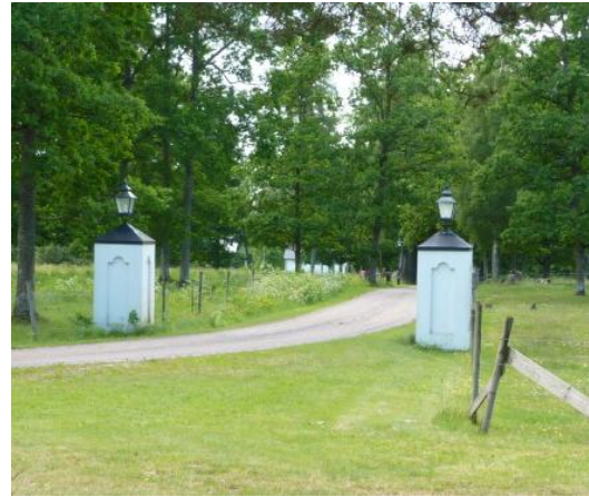
Portar till vilken egendom? RUDERS EGENDOM