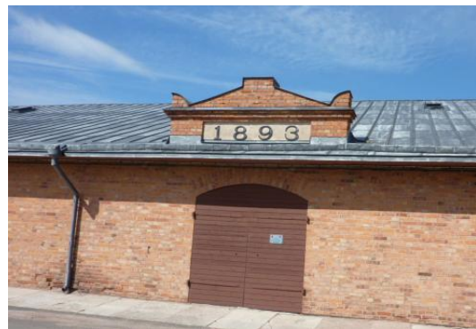
Vart hittar du denna byggnad? KARLSBORGS FÄSTING