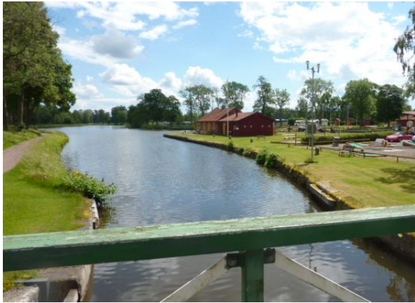
Vad heter slussområdet? VASSBACKEN